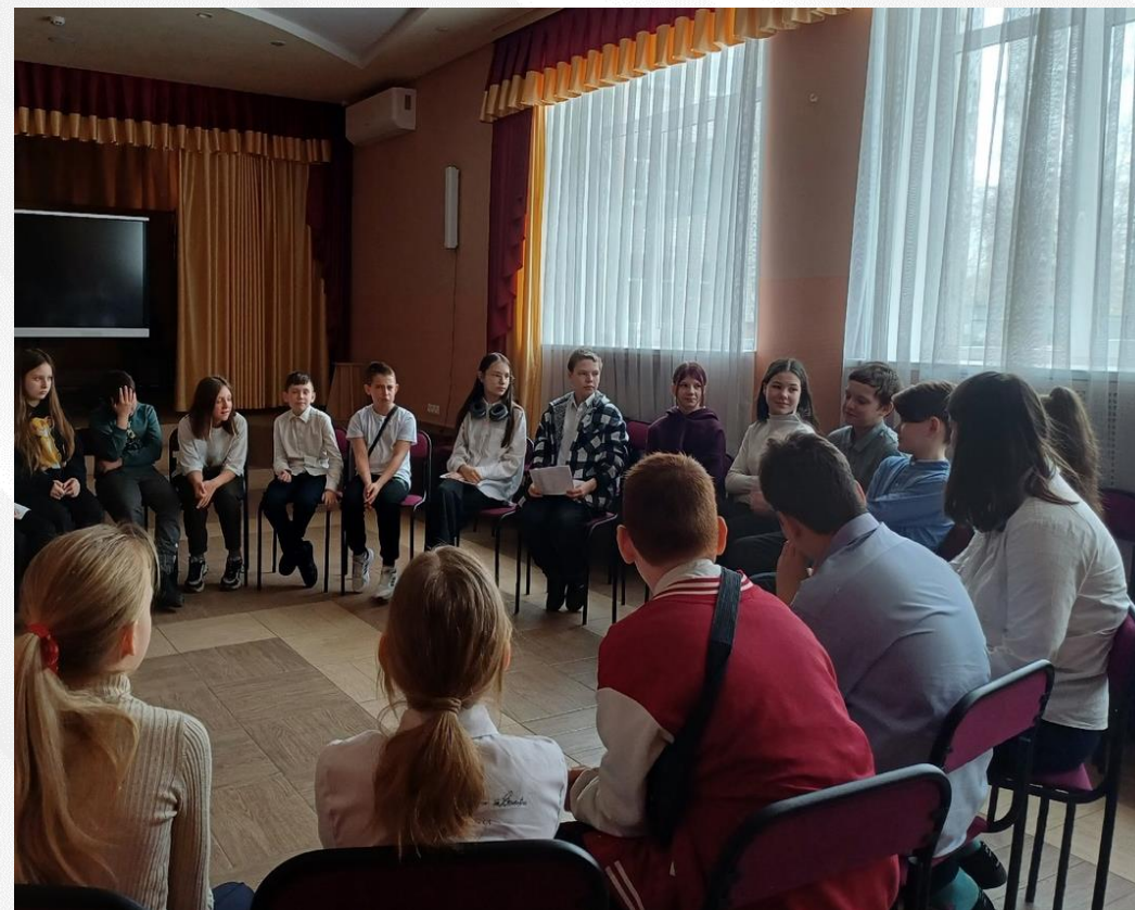
Круг сообщества «Давайте дружить»