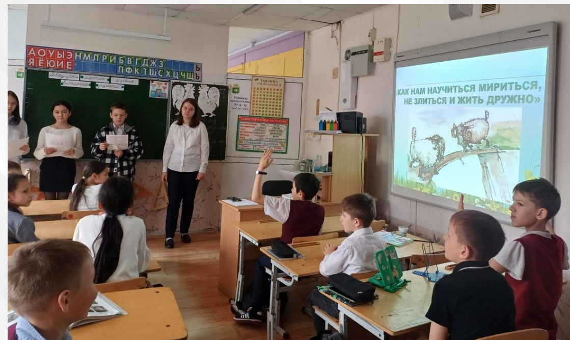
Тренинг «Как нам научиться не злиться, мириться и жить дружно»