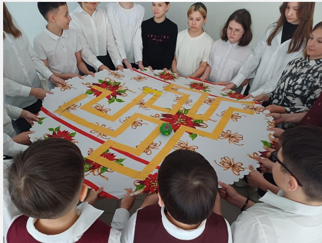
Квест-игра «Дружба – это ценный дар»